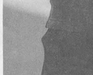
VIDEO McCartney: «Al Colosseo riprenderò tutto. Perché è un evento storico. Poi si vedrà»